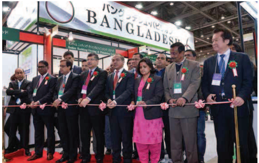
2015年1月展バングラデシュパビリオン オープニングセレモニー

意外に知られていない!? 世界第2位の繊維輸出大国バングラデシュ。中国に次いで世界のアパレル生産を担う存在だ。そんなバングラデシュが今回、JFW-IFFにパビリオンで出展が決まっている（ブースNo. D-302）。各出展企業の協力のもと、ディスプレイの工夫やサンプル商品展示の充実、通訳の常駐や丁寧なブース接客など、バングラデシュの魅力が伝わる仕掛けがあり見逃せない。日本ではまだ馴染みの薄い国だからこそ、この機会にぜひバングラデシュのファッション・アパレル産業について学んでみては。