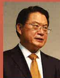
リー・ヨン UNIDO 事務局長

産業開発と繁栄の共有～ポスト2015年開発アジェンダ時代の官民連携」では基調講演を行い、UNIDO が推進する「包摂的かつ持続可能な産業開発」の重要性を訴えました。