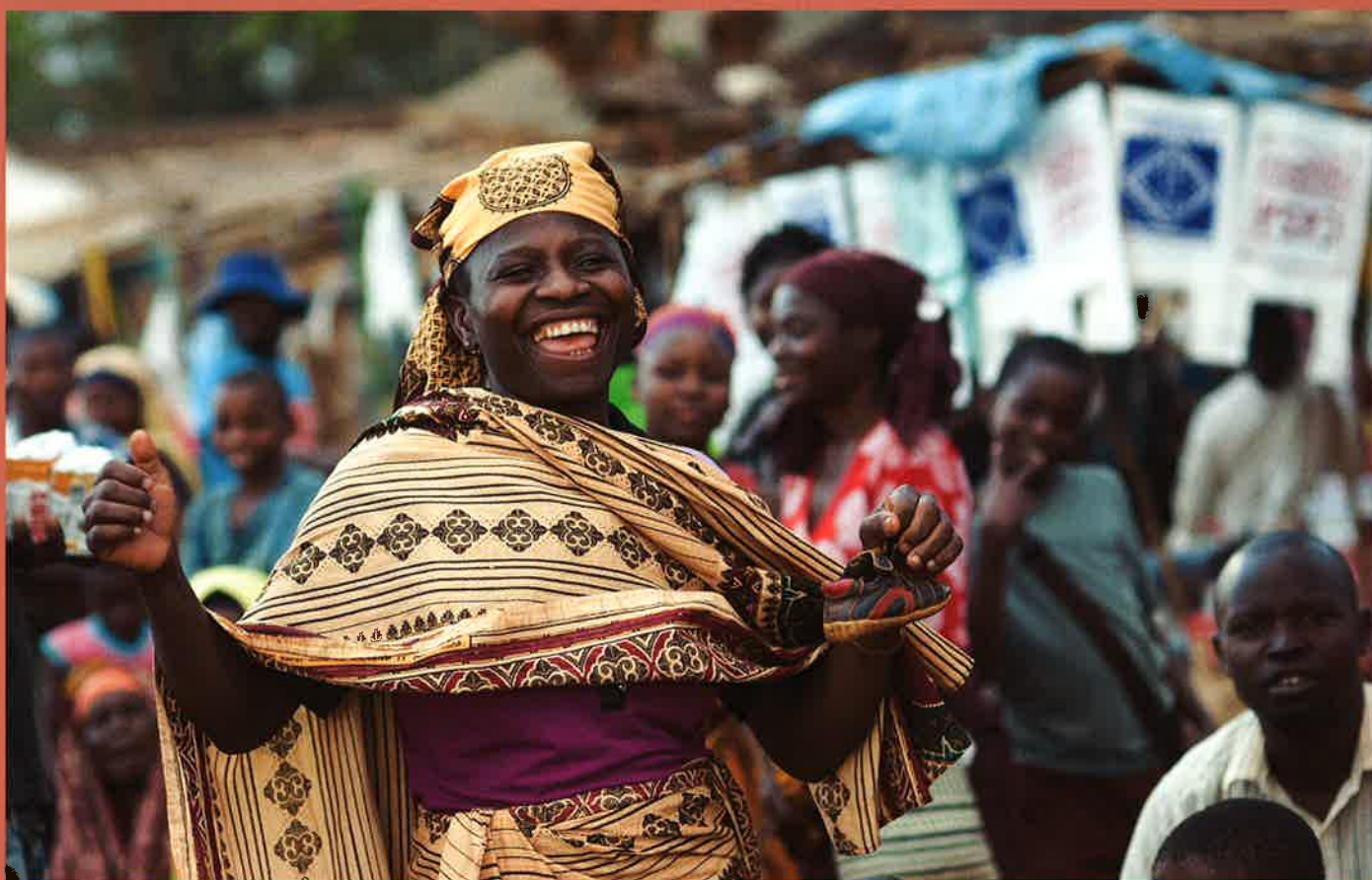
モザンビーク バス停の女性