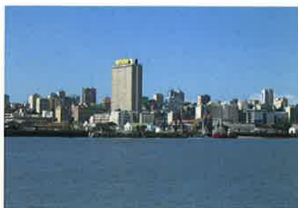
首都マプト

モザンビークへは日本企業も多く進出しています。例えば、三井物産は現地の企業と合弁で天然資源の開発を行っていますし、双日は100%自己資本で進出し、ウッドチップの製造を行っています。中古品販売の分野で現地企業と直接取引を行う企業