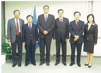
UNIDO本部担当部・課長とアジア地区ITPO事務所長

去る10月8日、アジア地区のUNIDO投資・技術移転促進事務所（ITPO）所長会議が東京にて開催されました。本会議には、北京、上海、ソウル、東京のITPO所長の他、UNIDO本部ビジネス・投資・技術サービス部の部・課長が参加、各ITPOの事業活動につい