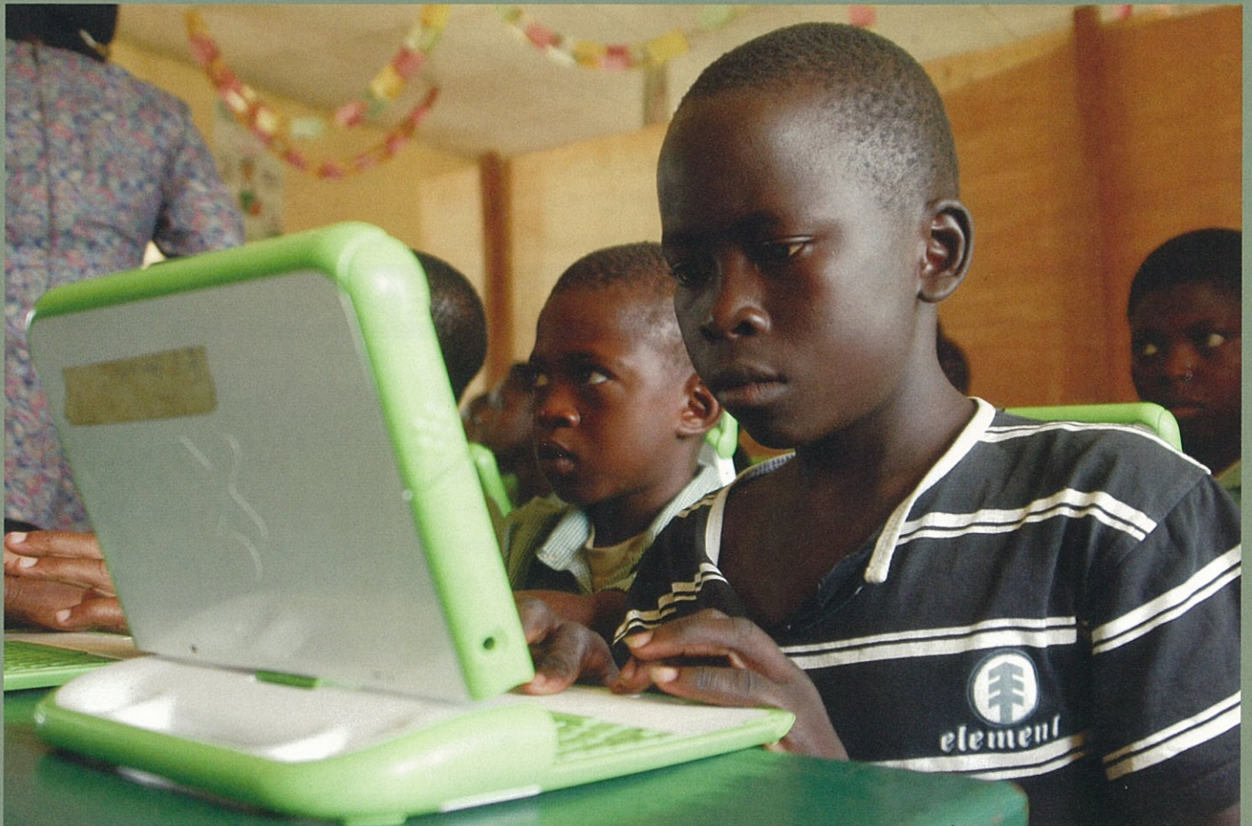
ナイジェリアの首都アブジャの小学校でパソコンに触れる児童