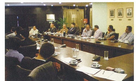
日系物流企業との面談

スリランカはミャンマーやバングラデシュに比べると労働コストは若干高めではあるものの、識字率の高さは南西アジア随一であり、労働力の質において高い評価を受けています。その一方で、訪問した日系企業からは、コロombo近郊などでは、縫製、組立てなど労働集約的産業においては人手不足が顕著であるとの声も寄せられました。また、賃金