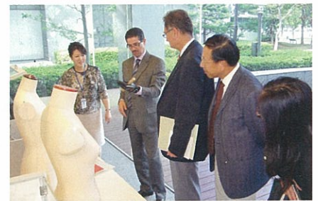
AIST臨海副都心センター展示場を見学

なお、次回のアジアITPO所長会議は、2011年9月に中国・アモイにて開催される予定です。