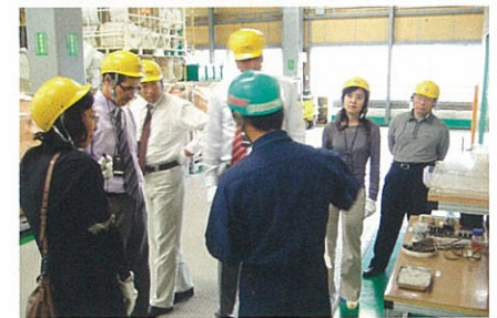
HCSリサイクル工場を視察