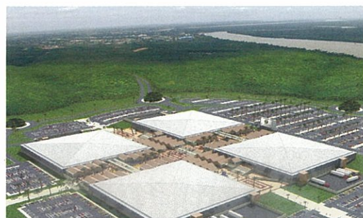
フリーゾーン

今回の来日では、日本各地で自動車関連企業の方々や政府・団体関係者とお会いし、好感触を得ることができました。日本車はナイジェリアでは大変人気があり、国内の自動車の6割以上が日本車です。しかし、最近は中国や韓国のメーカーが進出してきており、徐々にシェアを拡大しています。ナイジェリアはアフリカ随一の約1億5000万人の人口を擁する国で、1999年に民政に移行してからは、政治的にも社会的にも安定してきています。高い技術力を持つ日本企業にも、フリーゾーンなどを活用して、この潜在的に巨大な消費者市場に積極的に進出していただきたいと考えています。