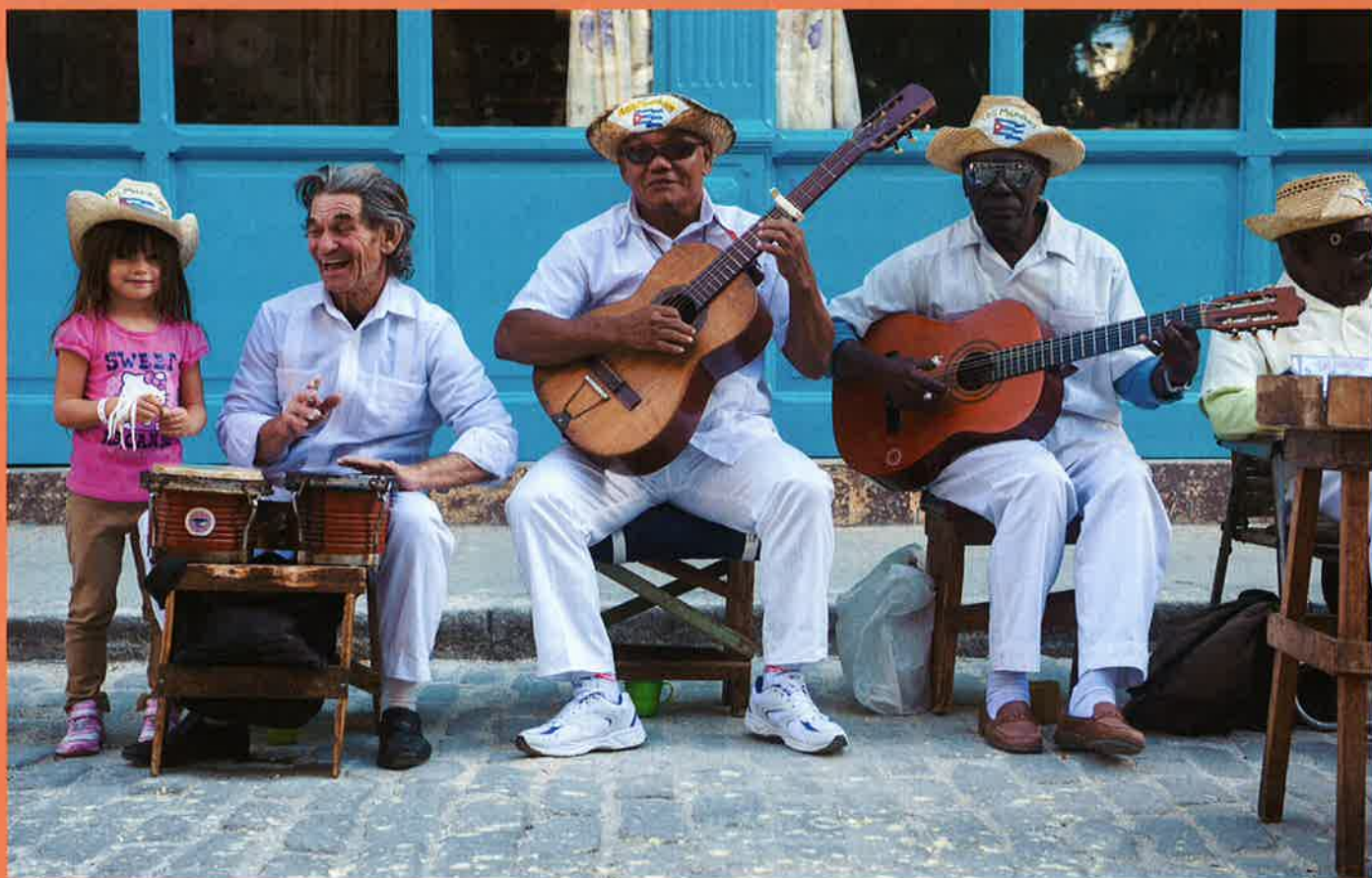
キューバのストリートバンド