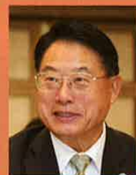
リー・ヨン UNIDO 事務局長

大使や日本政府関係機関・民間企業らとの官民協力対話において、アフリカを始めとする新興国における UNIDO の活動を紹介し、相互にとって利益となる連携について意見交換を行ないました。