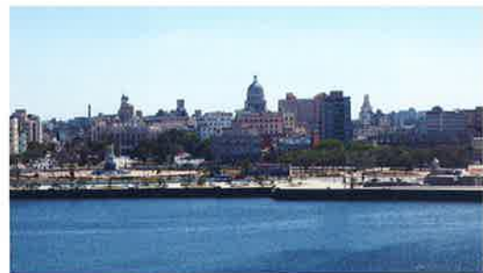
ハバナの街並み

ハバナの西45キロに位置するマリエル特別開発区は、湾港やコンテナターミナルに隣接しており物流の拠点として最