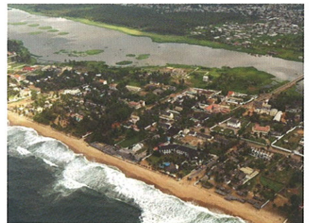
グラン・バッサムの歴史都市

コートジボワールは、2020年までの新興国入りを目指しており、民間投資の促進を主軸とした国家開発計画を実施していますが、第1次計画(2012年~2015