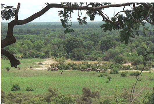
世界遺産・タイ国立公園

現在日本からは味の素、伊藤忠、豊田通商等の企業が進出し活躍していますが、これからは大企業だけでなく中小企業にも来ていただき、現地の企業と一緒にプロジェクトを組み、ビジネスを展開して欲しいと思います。日本企業の参入により、コートジボワールの市場が活性化することを願っています。