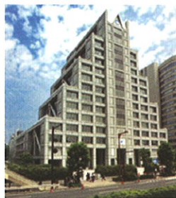
国連大学本部ビル