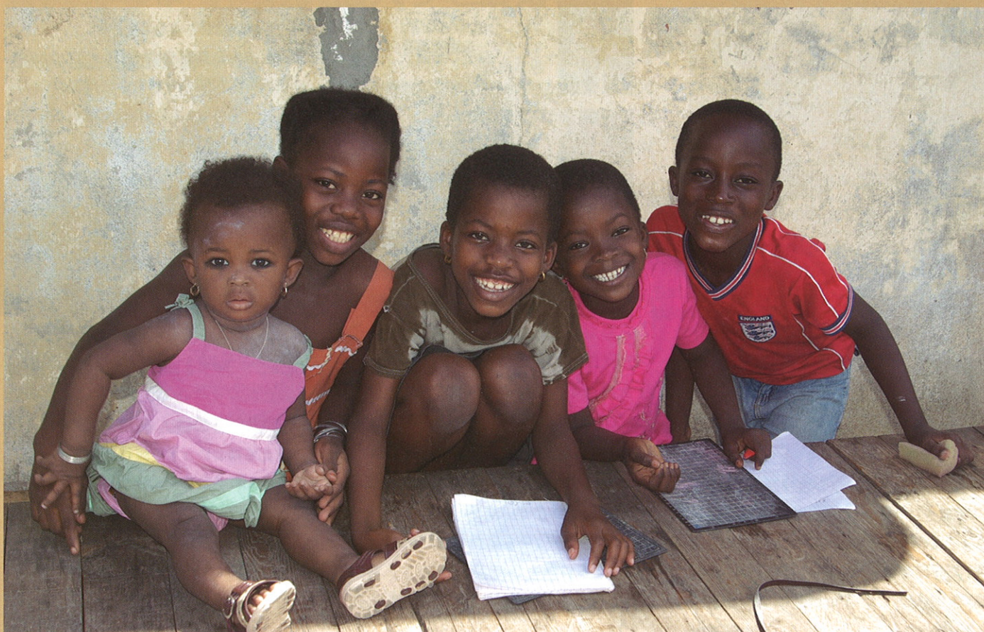
コートジボワール アビジャンの子ども達