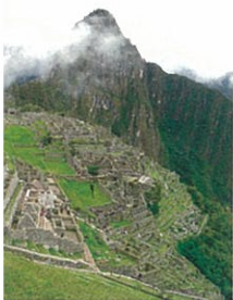
マチュピチュ