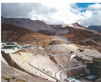
埋蔵量の豊富な鉱山