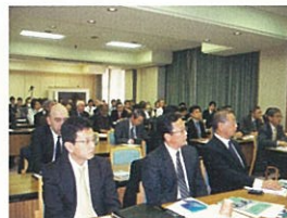
パキスタン経済セミナー

バングラデシュ、アルゼンチン、トルコ、パキスタン、ケニア、スリランカ、ウズベキスタン、ルーマニア、アゼルバイジャン、カンボジア、チェコ、クロアチア、モロッコ、スロバキア、ペルー、インドを始めとする国や地域を対象とした計25件の投資促進セミナーを政府関連機関、業界団体などと協力して開催しました。