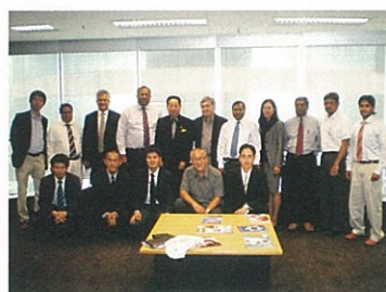
スリランカ・ビジネスミッション