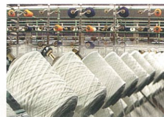
高品質を誇る繊維産業

ペルーには約10万人の日系人コミュニティがあり、リマには日本人学校もあります。食材が豊富で、グルメの国としても知られています。また、気候も良く、とても暮らしやすい国です。日本とペルーは2010年11月に経済連携協定(EPA)締結に基本合意しました。今後両国の経済関係はますます緊密になることと思われます。インフラ整備からニッチ市場までさまざまな投資機会があるペルーへの日本企業の進出を期待しています。