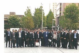
「2010鉄道技術展」での円卓会議出席者