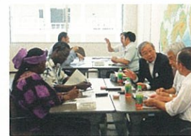
水処理・エネルギー関連企業との意見交換会