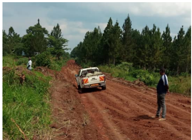
MoWTはプロジェクトサイトのデューデリジェンスを実施しました