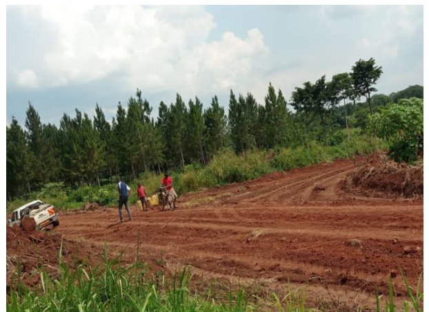
公道からトレーニングセンターへの道が改善されました