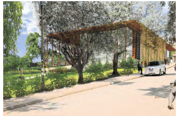
環境配慮型の建築会社を訪問しました。