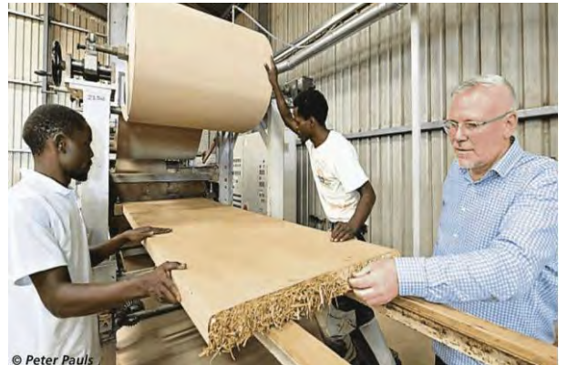
環境配慮型の建築会社を訪問しました。